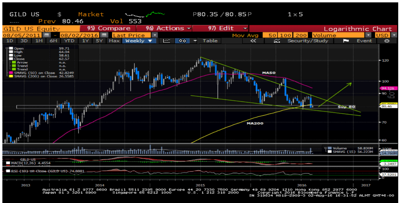
График 1. Масштаб – Неделя.