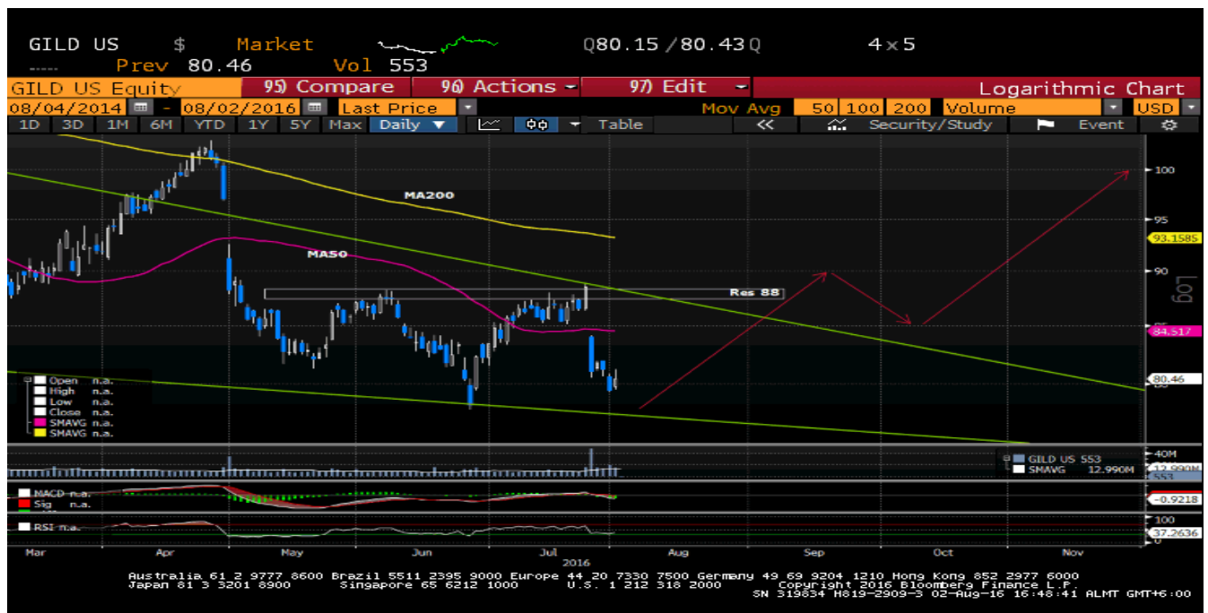
График 2. Масштаб – День