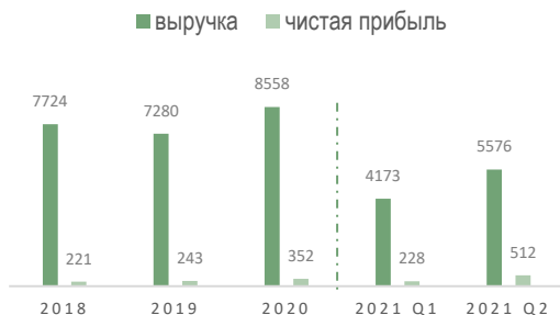
Выручка и чистая прибыль, млн $