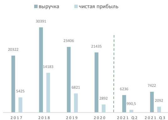
Выручка и чистая прибыль, $ млн

Micron Technology, Inc. – компания специализируется на производстве полупроводников, основную часть которой составляют чипы памяти DRAM и NAND.