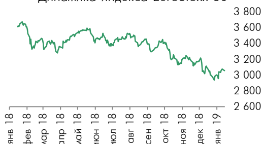
Динамика индекса EuroStoxx 50

пунктов, французский индекс CAC40 снизился на 0,39% и германский индекс DAX снизился на 0,29%. Британский индекс FTSE 100 ослаб на 63,2 пункта (-0,91%).