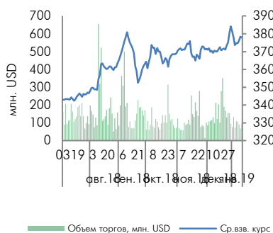
Динамика курса тенге