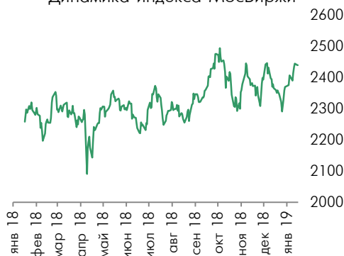
Динамика индекса Мосбиржи

Среди аутсайдеров торгов оказались акции ММК (-2,8%), Русала (-2,3%), Газпрома (-1,4%) и НЛМК (-1,08%).