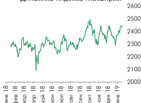
Динамика индекса Мосбиржи

Лидерами роста стали привилегированные акции Сбербанка, которые выросли на 1,65%. Обыкновенные акции банка выросли на 0,76%. Также подорожали акции Юнипро (+1,5%) и Мосбиржи (+1,4%).