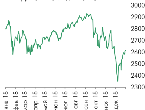
Динамика индекса S&P 500

Индекс S&P 500 вырос на 0,22% и высокотехнологический индекс Nasdaq вырос на 0,15%. Максимальный рост продемонстрировал индустриальный индекс Dow Jones, который вырос на 0,59% до 24 207,2 пунктов. Большинство секторов S&P 500 продемонстрировали позитивную динамику. Укрепились сектора здравоохранения и телекоммуникаций, которые выросли на 1,74%. Сектор финансов вырос на 0,81% благодаря сильной корпоративной отчетности банков. Ослабили сектора материалов (-0,65%) и промышленности (-0,32%).