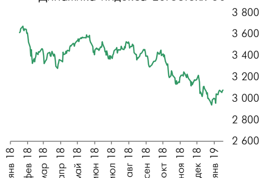
Динамика индекса EuroStoxx 50

французский индекс CAC40 вырос на 0,51% и германский индекс DAX вырос на 0,36%. Британский индекс FTSE 100 снизился на 0,47% и закрылся на уровне 6 862,7 пунктов на фоне политической неопределенности. Напомним, что британский парламент во вторник с подавляющим перевесом голосов отверг соглашение по Brexit, и оппозиция в Палате общин вчера инициировала голосование о доверии правительству.