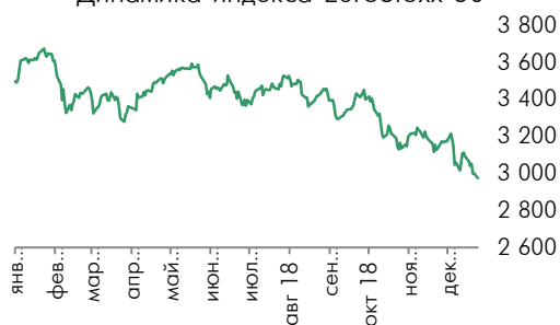
Динамика индекса EuroStoxx 50

председателя ФРС Джерома Пауэлла добавились к беспокойству о замедлении экономического роста.