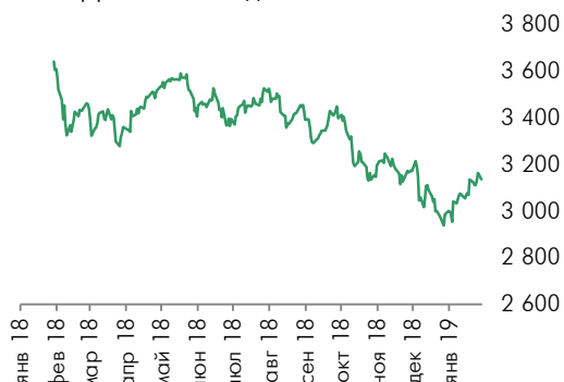
Динамика индекса EuroStoxx 50

По итогам торгов в понедельник подешевели акции банковского сектора: Barclays (-2,5%), Royal Bank of Scotland (-2%), HSBC (-1,1%).