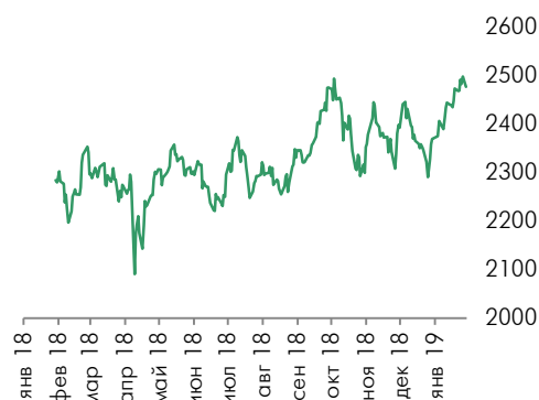
Динамика индекса Мосбиржи

Наибольшее снижение наблюдалось в акциях Мечела (-2,4%), Русала (-2,2%), X5 Retail Group (-1,1%), Юнипро (-1,8%) и Алроса (-1,8%).