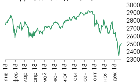
Динамика индекса S&amp;P 500

Рынок США: Американские фондовые индексы продемонстрировали позитивную динамику на фоне роста цен на нефть. Индекс S&P 500 вырос на 0,13%, индустриальный индекс Dow Jones вырос на 0,08%. В то время как высокотехнологический индекс Nasdaq вырос на 0,46%.