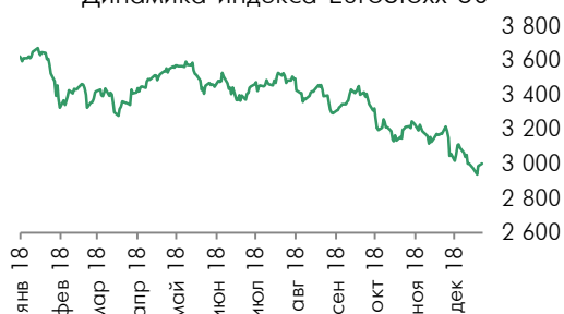
Динамика индекса EuroStoxx 50

экономики, торговый конфликт между КНР и США и другие геополитические факторы продолжают оказывать давление на рынки в новом 2019 году. По итогам торгов европейский индекс EuroStoxx50 снизился на 0,27% до 2993,2 пунктов, французский индекс CAC40 снизился на 0,87%, британский индекс FTSE 100 вырос на 0,09% и германский индекс DAX вырос на 0,2%.