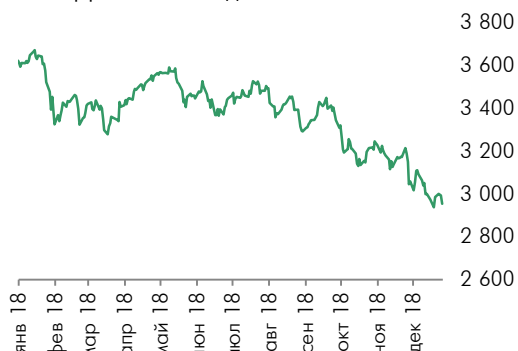
Динамика индекса EuroStoxx 50

Apple Inc. понизила прогноз квартальной выручки впервые почти за два десятилетия, отметив более слабые, чем ожидалось, продажи в Китае. На фоне этих новостей резко подешевели акции европейских поставщиков компании Apple и других представителей высокотехнологического сектора. Цены на акции чипмейкера AMS AG рухнули на 22%, Dialog Semiconductor Plc на 8,3%, STMicroelectronics NV на 10,5%.