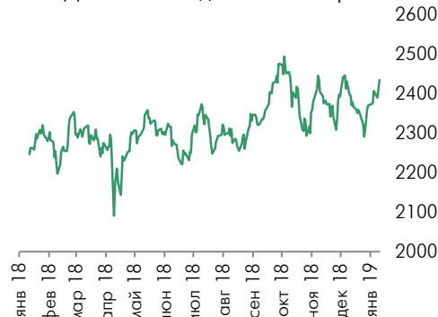
Динамика индекса Мосбиржи

Рубль немного снизился и закрылся на уровне 66,9 рублей за доллар. На следующей неделе ЦБ возобновит регулярные покупки в рамках бюджетного правила, что будет оказывать негативное влияние на рубль.