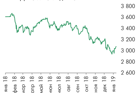
Динамика индекса EuroStoxx 50

FTSE 100 вырос на 0,52% и германский индекс DAX вырос на 0,26%. Французский индекс CAC40 снизился на 0,16% на фоне слабой статистики. Объем промышленного производства во Франции по итогам ноября упал на 1,3% по сравнению с предыдущим месяцем. При этом аналитики ожидали в среднем повышения на 0,1%. В годовом выражении промпроизводство снизилось на 2,1%.