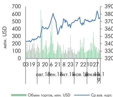
Динамика курса тенге